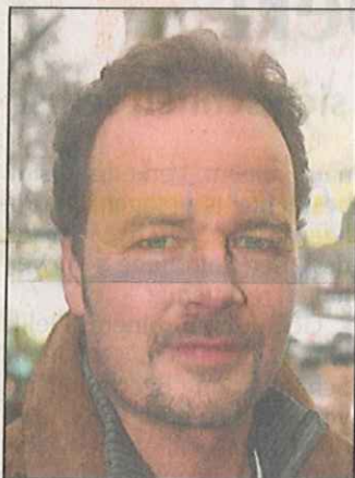
Schauspieler Till Demtröder.

4 Teams – je eines für ein Bundesland des NDR-Sendegebietes, Niedersachsen, Schleswig-Holstein, Mecklenburg-Vorpommern und Hamburg – treten zum Länderwettkampf in Hagen a. T. W. an. Je-