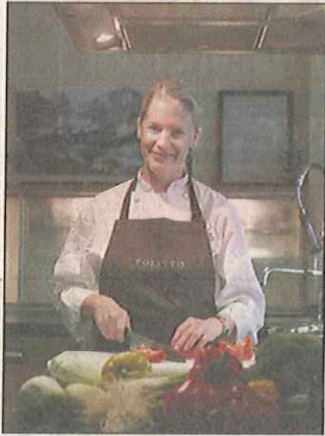
Mit dabei: Sterneköchin Cornelia Poletto.