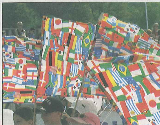
Teilnehmer aus 20 Nationen sind gemeldet.

ebenfalls. Allein 6-mal Spring-sport pur offeriert der Freitag den Zuschauern, und im Dressurviereck fällt die Entscheidung im internationalen Grand