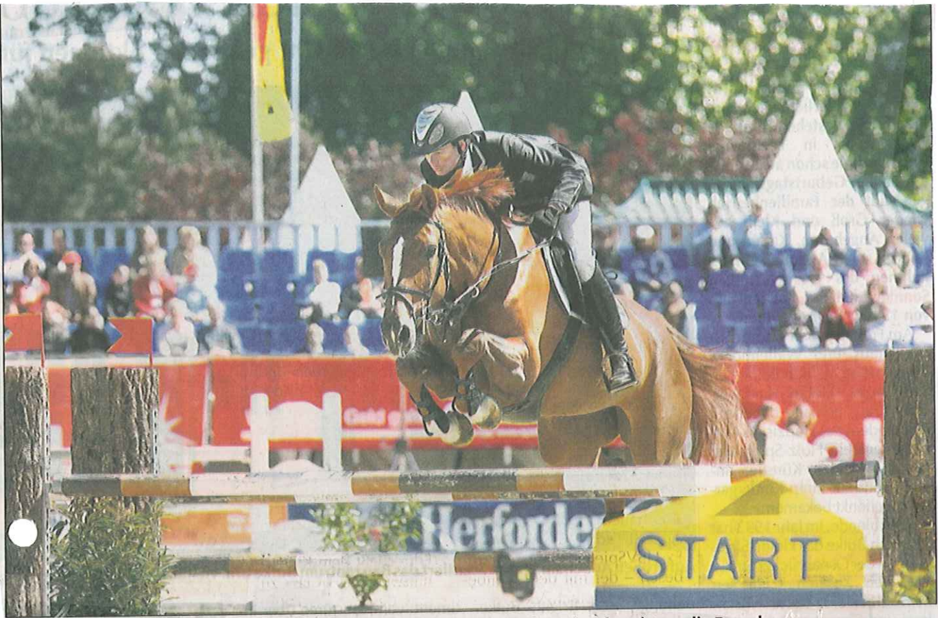
12 internationale Springprüfungen, dazu 9 Prüfungen der Amateur-Springreiter, begeistern die Besucher.