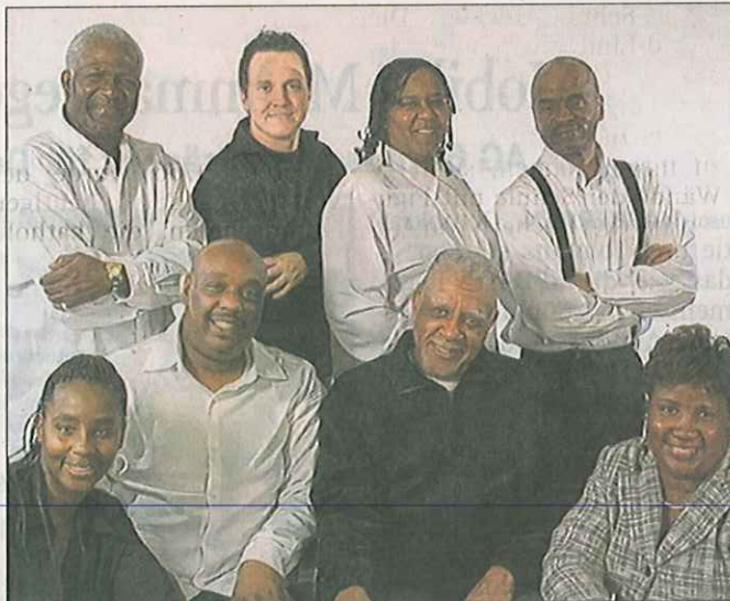
Tritt am Mittwoch, 26. April, nach dem ökumenischen Eröffnungsgottesdienst im großen Horses-&-Dreams-Festzelt auf dem Hof Kasselmann auf: der „Louisiana Gospel Chor“ aus New Orleans.

Der erste Abend von „Horses & Dreams Meets America“ verspricht ein musikalischer Hochgenuss zu werden. Zu Beginn werden die Gäste von dem Prince of New Orleans, Thomas Gerdiken, am Piano begrüßt: „New Orleans zu